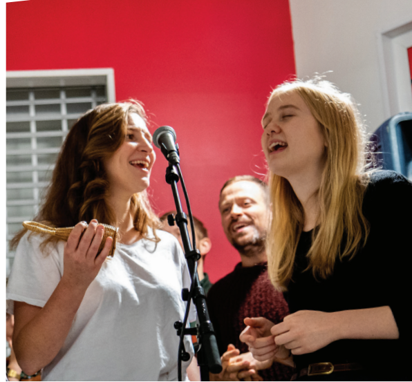
1: MUA-KURSDELTAKERE ØVER IVRIG PÅ MUSIKKLEK 2: FOLKAMP-GJENGEN FREMFØRER MUSIKK FRA HELE VERDEN – BLANT ANNET PÅ ET KJØPESENTER I VOLDA!

prosjekter i et globalt nettverk. Det ble gjennomført en alumnisamling for norske deltakere i mai, samt en internasjonal alumnisamling i Oslo i august. Her ble det lagt et viktig grunnlag for et internasjonalt nettverk som vi håper å videreutvikle i framtiden.